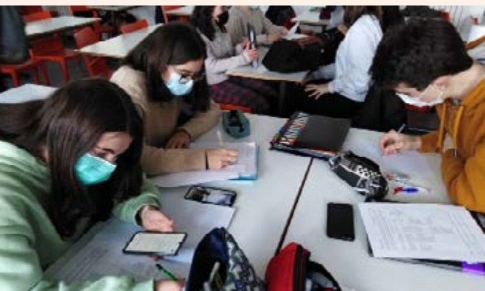
Travaux de groupe en euro anglais.

Le lycée Saint-Louis propose, sur le temps du midi, aux élèves qui le souhaitent, l'euro anglais, une option afin d'approfondir la connaissance et la maîtrise de la langue anglaise. L'Euro anglais est proposé aux trois niveaux: seconde, première et terminale. Cette option, très intéressante, leur permet également de s'enrichir culturellement.