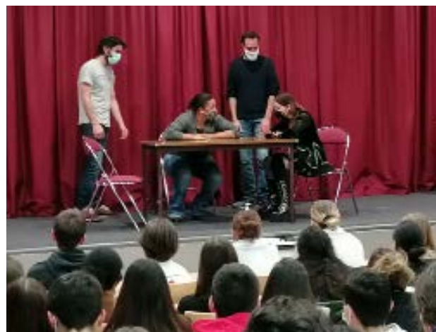
← Une élève tente de changer le cours des choses (théâtre forum).

M i-décembre, toutes les classes de première du lycée Saint-Louis ont participé à une représentation de théâtre forum de la compagnie Instant(s) intitulée: Troubles de vie . Cette troupe, composée de comédiens professionnels, invite les élèves à réfléchir aux conduites à risques souvent liées à l'adolescence. Avec les premières, ils se sont arrêtés sur des notions de cyberdépendance et des influences pouvant générer des situations dangereuses. Le théâtre forum repose sur l'interaction entre les comédiens et leur public.