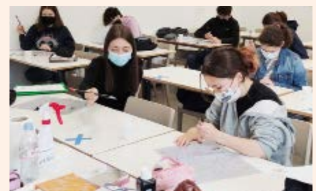
Des élèves s'exercent à la calligraphie en option chinois.

L'établissement propose également une option chinois.