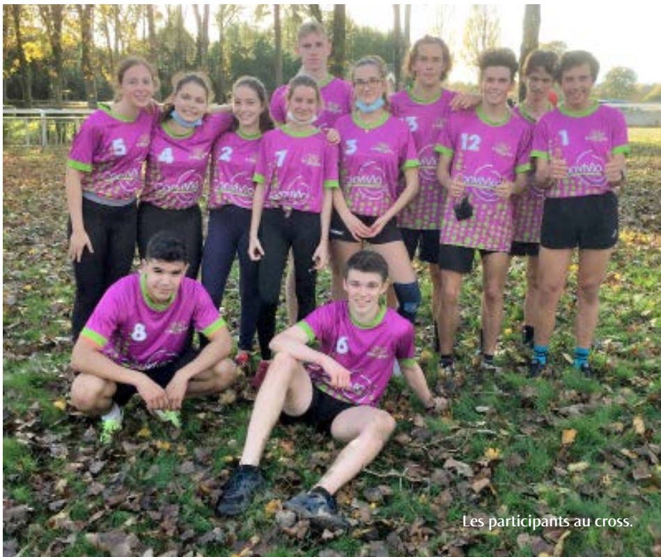
Les participants au cross.