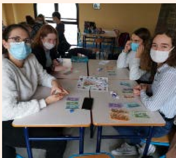
Créer un jeu en euro allemand.