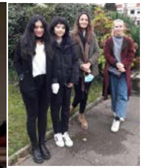
La chargée de projet et les bénévoles.

"LA JEUNESSE EST FORMIDABLE QUAND ELLE EST MOTIVÉE." SŒUR EMMANUELLE