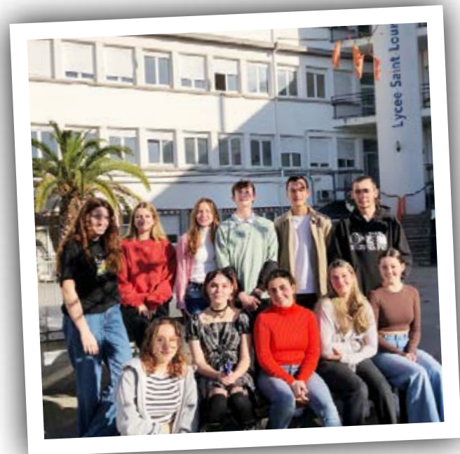
↑ L'équipe du BDE.