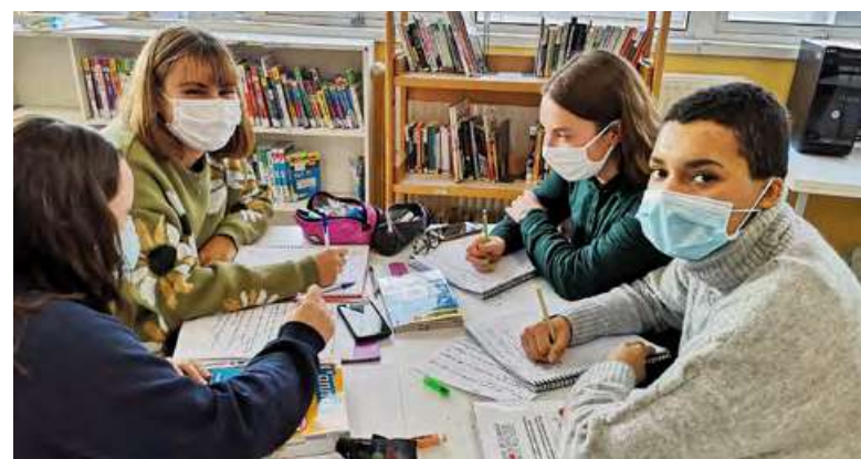
⋈ Des élèves de terminale en spé géopolitique.