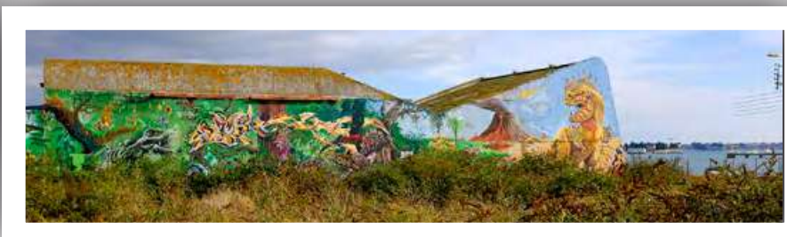
Fresque vue sur mer.