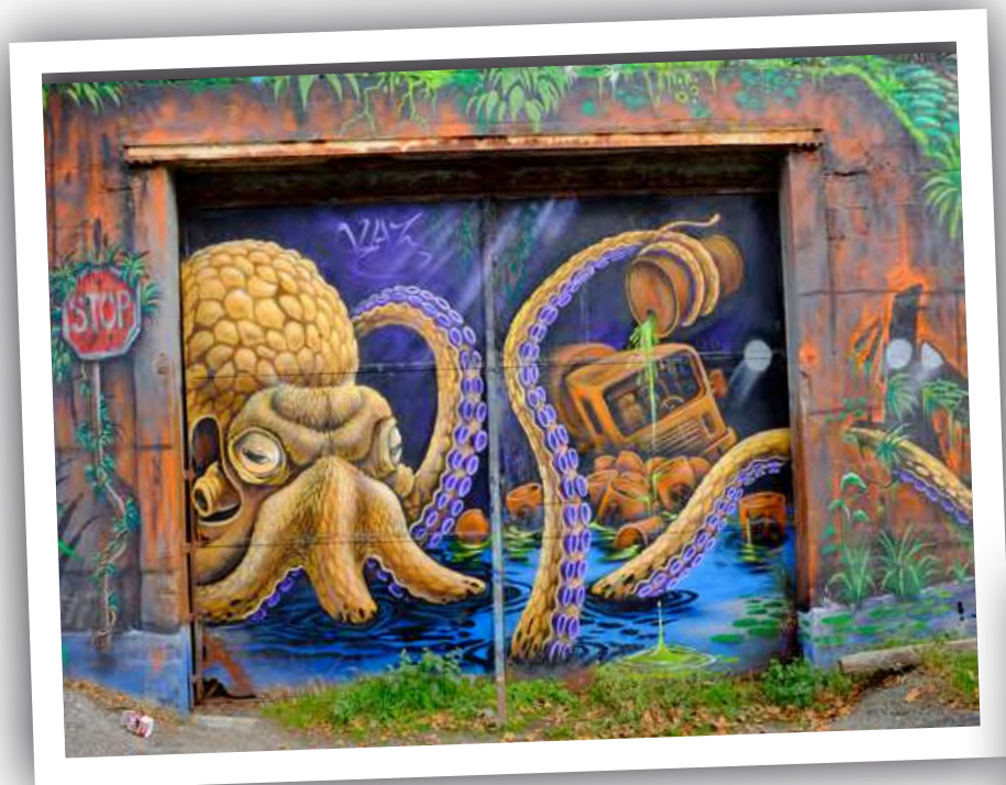
Street art Avenue de la Perrière.