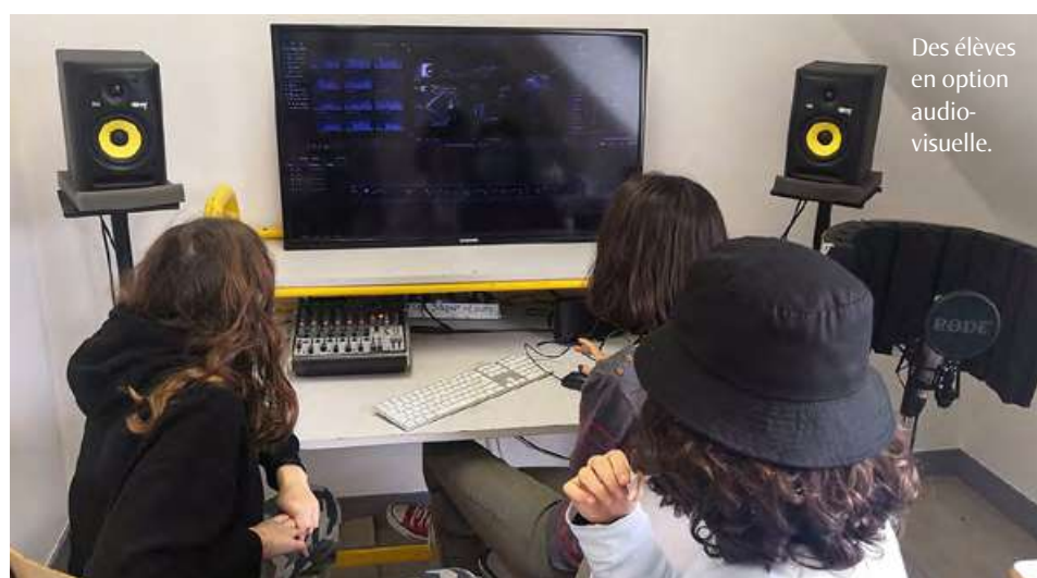
Des élèves en option audiovisuelle.